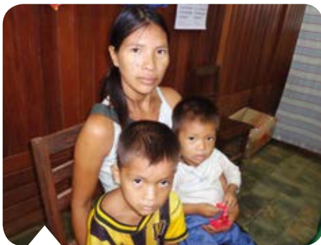
Zij zoeken bij ons hun toevlucht.

In de kliniek gaat de aandacht in de eerste plaats uit naar de aller-