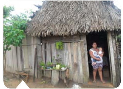
Arme families moeten soms grote afstanden door het oerwoud afleggen om bij onze gezondheidskliniek hulp te krijgen voor hun zieke kind.

Een consult kost in onze kliniek 10 Boliviano's, dat is iets meer dan 1 euro. Zelfs dat kunnen sommige